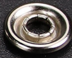
母扣 x 25PCS