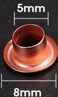
雞眼扣 x 100PCS