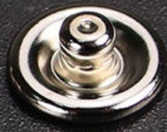
公扣 x 25PCS