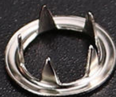
五抓扣 x 50PCS